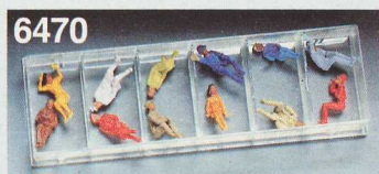
6470 Siddende rejsende til HO-vogne. 12 forskelligt farvede figurer.

Yderligere anvendelses-eksempler for FLEISCHMANN HO-VARIO-systemer i sporplanhefterne 9900 og 9902 samt sporplanbogen 9912 (se side 74).