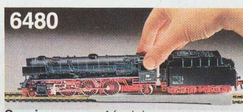
6480 Springsapparat for lok og vogne.

6481 Losseanordning til tipvogn 5500 (se side 41 og 64).